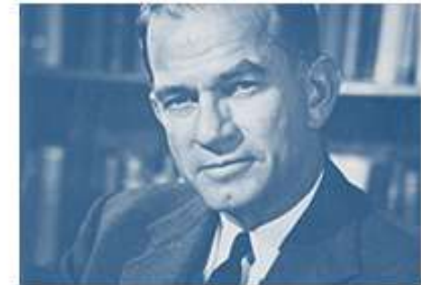
Senator J. William Fulbright