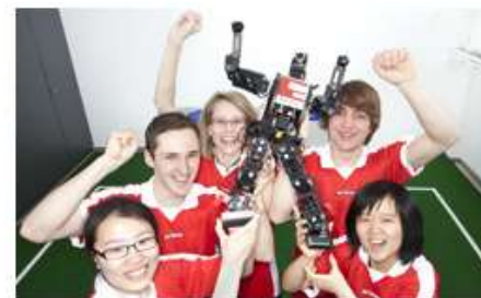
91 Deutschlandstipendien vergibt die TU Darmstadt 2011.